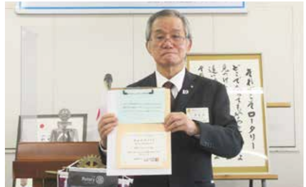
米山功労クラブ 対象:野田ロータリークラブ