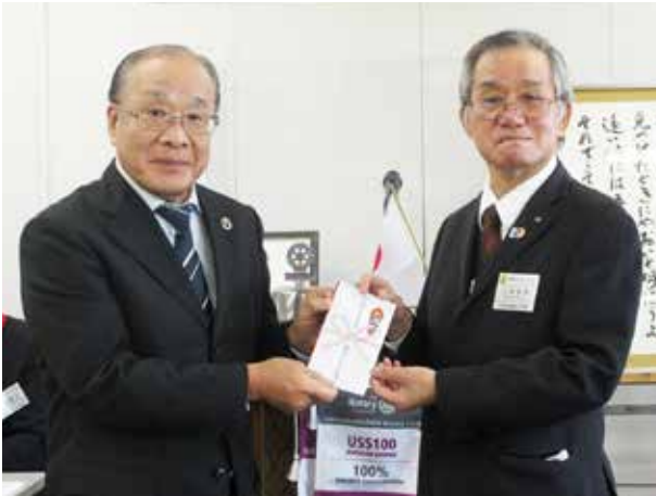
歳末たすけあい募金