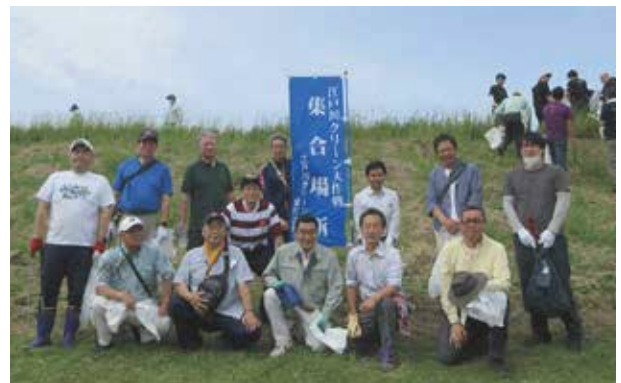
5月28日 江戸川クリーン大作戦