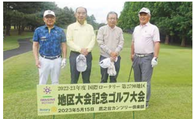
5月15日第2790地区親睦ゴルフ大会