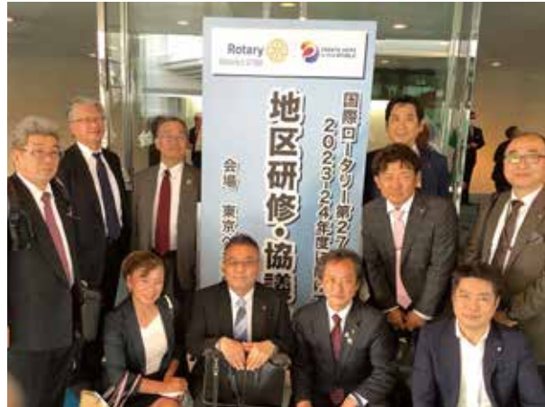
4月29日 地区研修協議会