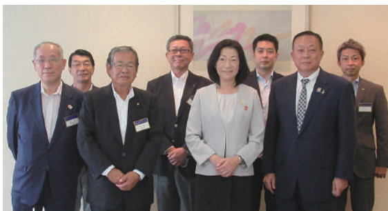
野田ロータリークラブ