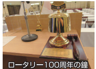
ロータリー100周年の鐘