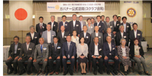
野田ロータリークラブ