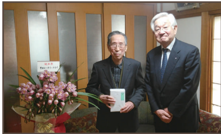
宇佐見会員 記念品贈呈