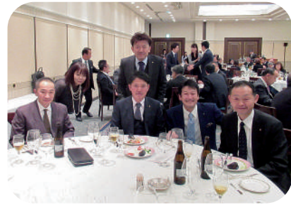
親睦活動委員会の皆さん