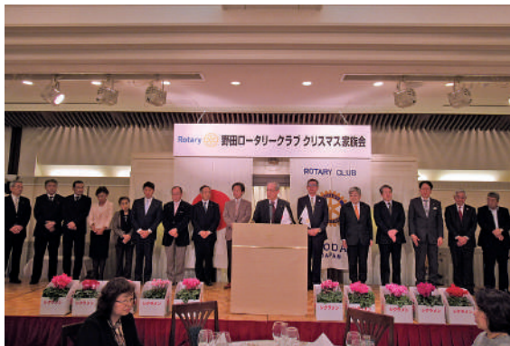
次年度役員、委員長の皆様