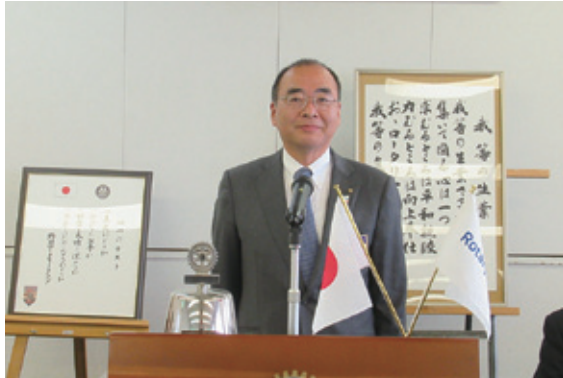
米山記念奨学会 特別寄付金について