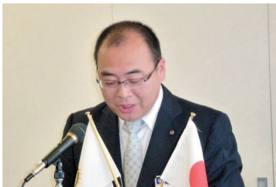
ホームページの件