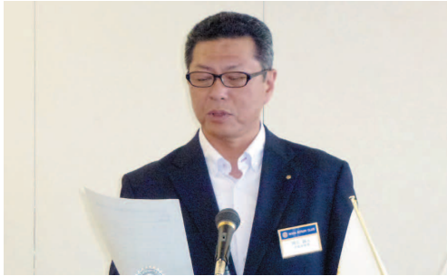
13分区合同ゴルフコンペ 11月12日(月)