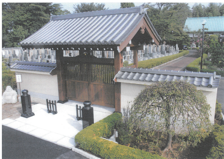
真光寺 応仁2年(1468年)創立