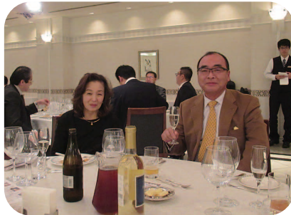
古谷会員と令夫人