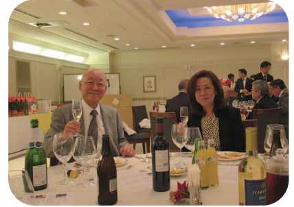
茂木会長と令夫人