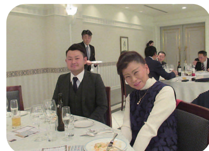
白島会員と御子息