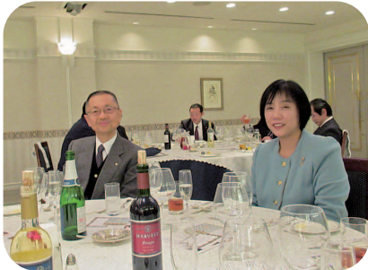
中野会員と令夫人