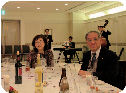
栗林会員と令夫人