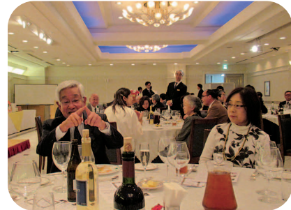
富山会長エレクトと令夫人