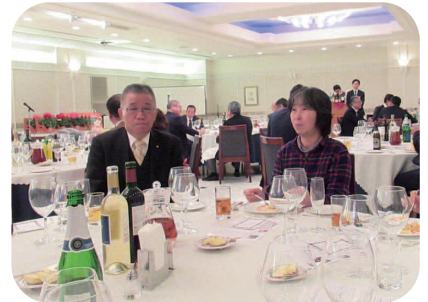
三浦会員と令夫人