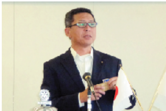
8/20夜間例会(潮の湯)について