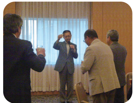
第1日目夕食 都市センターホテル