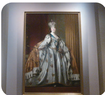
大エルミタージュ美術館展 エカテリーナ2世