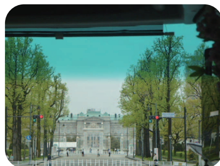
迎賓館 赤坂離宮 車窓より