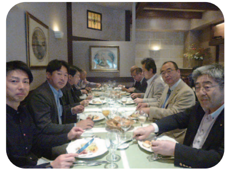
2日目昼食 ビストロボンファムにて