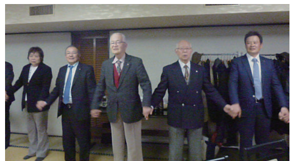
染谷 肇 会員 作成