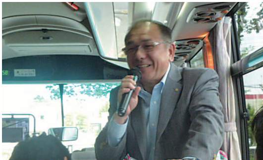
楽しい旅行になりますよう親睦委員頑張ります。