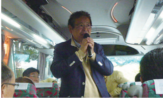
4/25 情報研究会 PM5:00より報恩寺にて