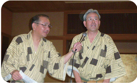
中メ 仲長エレクト