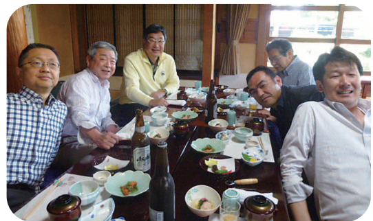
富岡 ときわ荘にて昼食