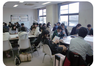
野田RC事前オリエンテーション(岡部委員長事務所にて)