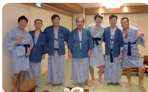
となりの戸田ロータリークラブへごあいさつ