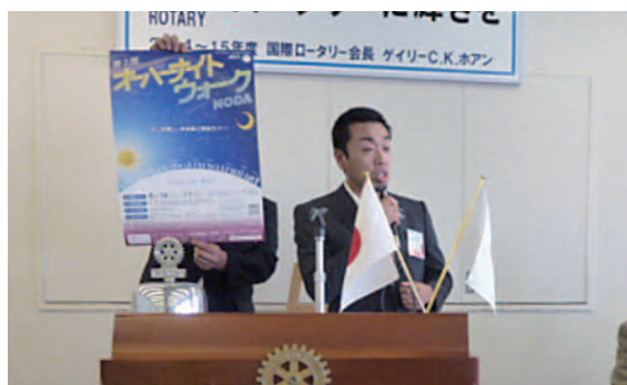
8/16.17 オーバーナイトウォーク