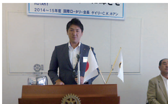
10/18.19 歩行フリー R Y L A セミナー