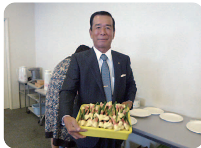
石山農園直送の“甘い生姜”ごちそうさまでした。