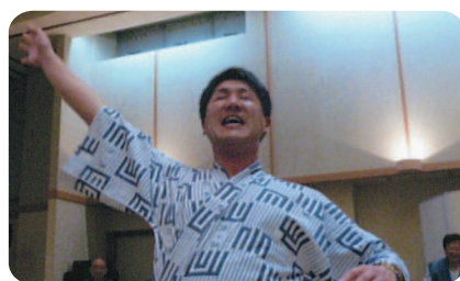
次期会長にエール