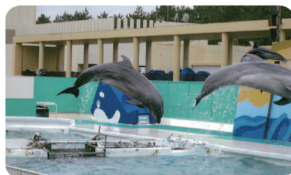
シーワールド シャチの曲芸