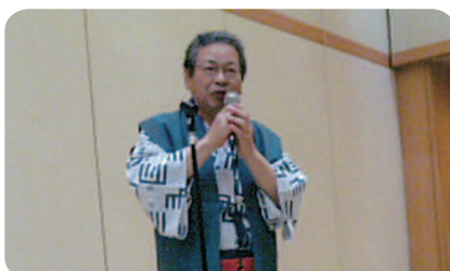
鴨川館で宴会 会長挨拶