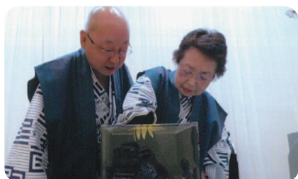
50円玉つかみ取り 5,000円、食券、ワインボトル当たる