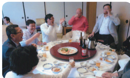
重慶飯店 紹興酒で乾杯