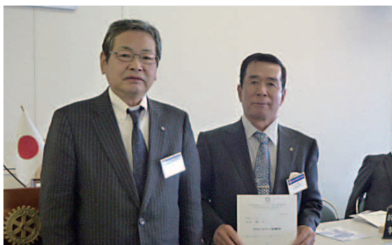
米山奨学会よりカウンセラー委嘱状が来ました。