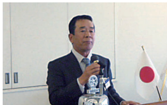
ゴルフコンペ結果報告