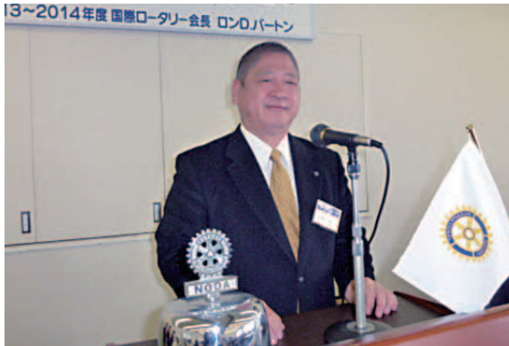
第2回 情報研究会 3月24日開きます。