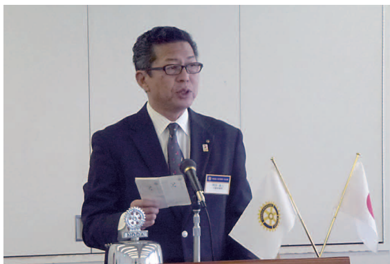
次年度ガバナー公式訪問9月22日(月) 3クラブ合同で行います。