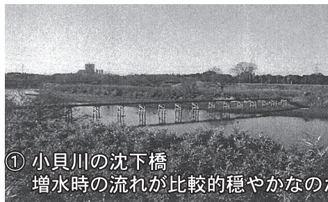
① 小貝川の沈下橋 増水時の流れが比較的穏やかなのか木製