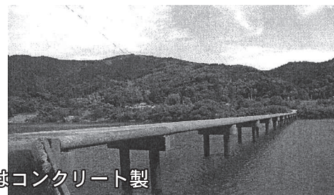
四万十川はコンクリート製