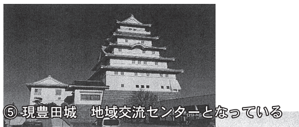
⑤ 現豊田城 地域交流センターとなっている