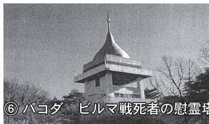
⑥ パコダ ビルマ戦死者の慰霊塔