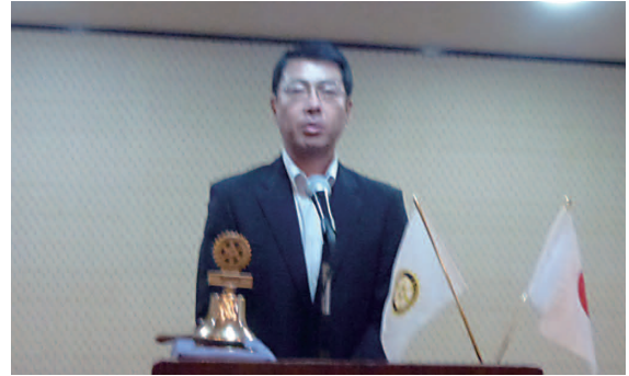
転勤のため退会いたします。