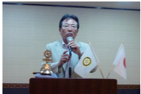
「ダメ。ゼツタイ。」薬物乱用対策キャンペーン 8名出席。