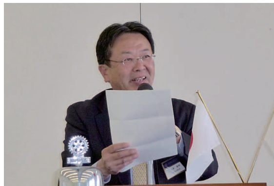
ゴミゼロ運動 5/26(日) 野田橋 8:30